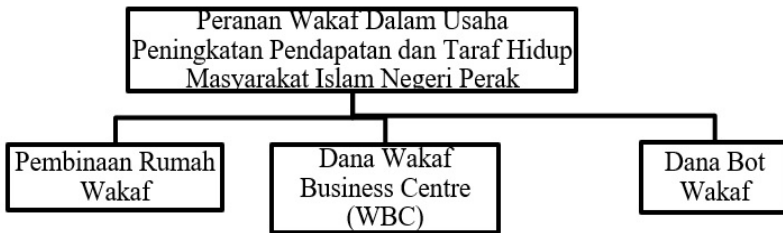
Rajah 3: Peranan Wakaf dalam membantu pembangunan ekonomi masyarakat Islam negeri Perak