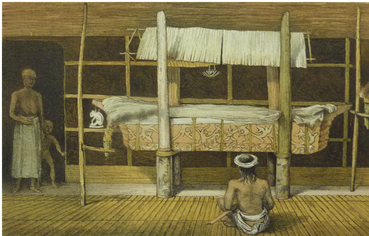
Gambar 5: 'Dayak Chief Lying in State; showing widow and child with head shaven in token of mourning', (Jenazah Ketua Dayak, menunjukkan balu dan anaknya dengan kepala yang dicukur sebagai tanda berkabung)

(Sumber: Mundy, Rodney, and James Brooke. Narrative of Events in Borneo and Celebes, Down to the Occupation of Labuan [Gambaran peristiwa di Borneo dan Celebes, hingga ke penjajahan Labuan]. Vol. 1, London J. Murray, 1846: 22.)