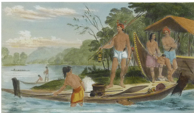
Gambar 3: Lundu Dyaks, (Dayak Lundu).