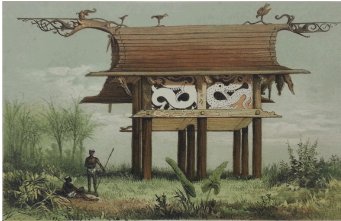
Gambar 6: Mausoleum of Rajah Sinen's Family, Bear Kibg Wau (Makam Ketua Puak Sinen's, Bear Kibg Wau)

ini puak tersebut akan berkumpul di rumah mendiang. Bermula dari situ, pembahagian tugas untuk urusan permakaman akan dimulakan. Sebahagian penduduk rumah panjang akan membina jambatan, memotong balak untuk membina keranda berbentuk perahu, mengukir tangkal serta arca yang menyerupai beruang ( thoeng ), harimau bintang ( lahdjio ) atau manusia yang diperbuat daripada kayu.