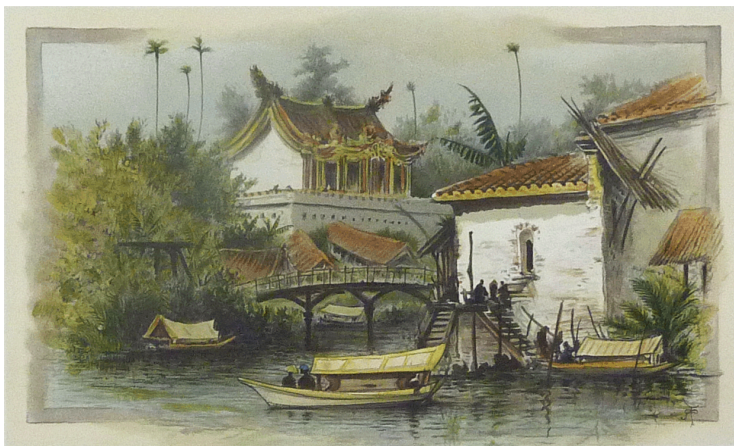
Gambar 8: 'Sarawak Borneo Opposite The Rajah Fort.' (Sarawak Borneo di hadapan Kota Raja Brooke)

Gambar 8 berukuran 21.8 x 14.2 cm yang dihasilkan dengan menggunakan teknik litografi berwarna oleh R.T. Pitchett pula merupakan pemandangan di seberang sungai mengadap kota milik Brooke. Artisan mengatakan bahawa beliau ketika itu bercadang untuk menyusuri sungai dan menyeberang ke pulau berkubu tetapi terhalang kerana hujan yang lebat. Namun sebahagian daripada kumpulan mereka berjaya ke kota tersebut dan menikmati pemandangan dari kawasan tinggi (Brassey dan Broome 1889).