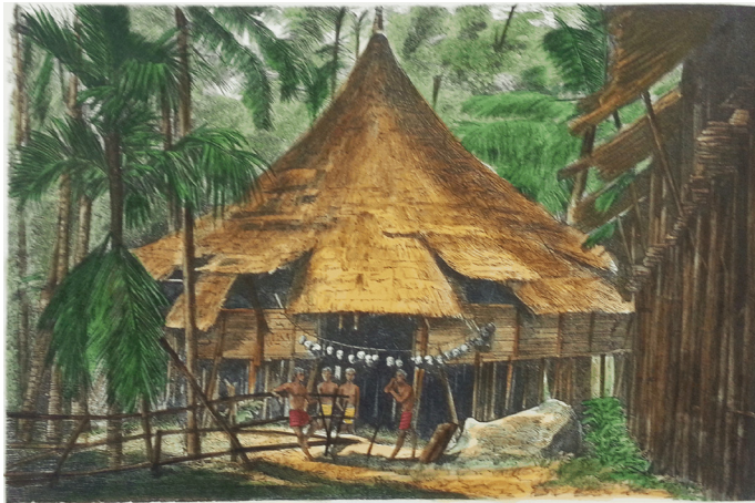
Gambar 7: 'Fine Dayak Hutte auf Borneo' (Pondok indah kaum Dayak di Borneo)

Visual seterusnya dari koleksi BSVN adalah Gambar 7, iaitu mengenai puak Bidayuh yang adalah antara puak orang Dayak di selatan Sarawak. Nama 'Bidayuh' membawa maksud 'Penduduk Dalam' (Tan 199) dan dikenali sebagai Dayak Darat ketika pemerintahan James Brooke. Gambar 7 yang berukuran 22.6 x 15.6 cm ini dicetak pada halaman 848 dan terhasil dari teknik gurisan kayu. Joseph Ven Lehnert (1887) mengatakan bahawa puak Bidayuh adalah daripada suku-suku yang bebas, tidak bergantung pada pemerintahan Belanda dan juga orang Melayu. Rumah mereka dibina di atas tiang setinggi 70-100 meter panjang dengan kelebaran 12-18 meter. Kebanyakan kampung hanya mempunyai dua atau tiga buah rumah. Lantai di dalam rumah diperbuat daripada buluh yang diraut, kira-kira seluas tangan dan diikat dengan rotan termasuk dinding dan tingkap. Setiap rumah mempunyai 8 hingga 10 bahagian dan setiap satu bahagian didiami oleh sebuah keluarga (von Lehnert 1878).