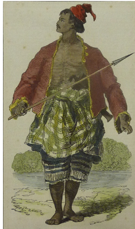
Gambar 1: Malay Native of Borneo-Sketched at Singapore (Lakaran Penduduk Melayu Tempatan Borneo di Singapura).

dan dicetak pada halaman 212 bersaiz 8 x 14.6 cm menggunakan teknik gurisan kayu. Amalan mewarnakan semula cetakan dengan menggunakan cat air sebenarnya menjadi kebiasaan dalam disiplin cetakan pada abad ke-18 dan ke-19 yang bertujuan mencantikkan cetakan tersebut selain menaikkan lagi nilai sesebuah cetakan.