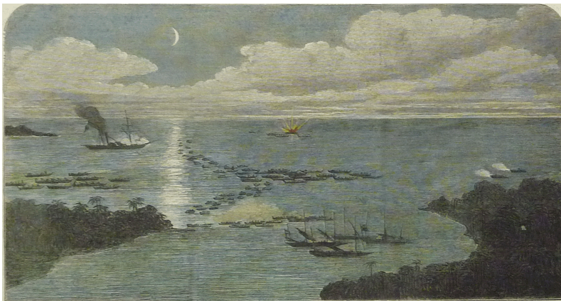
Gambar 9: 'Night Engagement of the English with the Pirates Off Banting Marron.' (Pertembungan di antara British dan Lanun di Banting Marron).

untuk berdagang dan mengembara pada abad ke-6. Namun kebanyakan mereka yang berada di Sarawak sekarang merupakan penghijrah yang datang beramai-ramai sekitar abad ke-19 dan ke-20. Kaum Cina yang pertama berhijrah ke Sarawak untuk bekerja terdiri daripada kaum Hakka yang bekerja sebagai pekerja lombong emas di Bau dan buruh ladang (Welman 2013). John S. Buckingham (1862) mengatakan bahawa pada peringkat awal hanya sekitar 200 orang Cina berada di Borneo, tetapi kemudiannya bertambah sehingga memerlukan pembukaan tanah baru. Selain itu, orang Cina yang merupakan penanam sayur yang mempunyai keluasan ladang berates-ratus ekar dan antara tanaman yang diusahakan ialah kacang dan keledak. Ladang mereka semakin luas apabila keledak mula mendapat perhatian berbanding sagu di Sarawak. Malahan kehadiran buruh di kawasan utara sungai Sarawak juga merupakan penyumbang keperluan terhadap bahan makanan (Buckingham 1862). Orang Cina sentiasa mengekalkan adat dan budaya mereka walau di mana mereka berada. Jelas di sini bagaimana kehadiran para peladang Cina di Sarawak juga turut mengubah landskap dan seni bina di Sarawak melalui binaan-binaan gaya mereka.