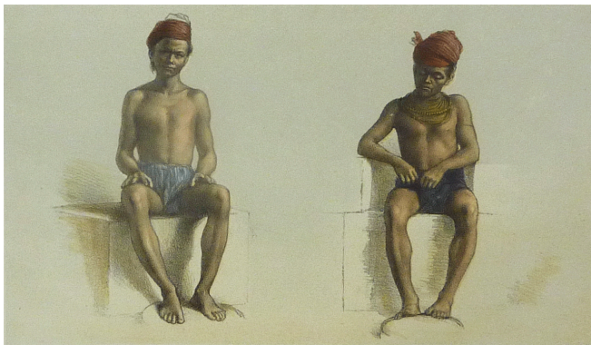
Gambar 2: ‘The Land Dayaks’ (Orang Dayak Darat).