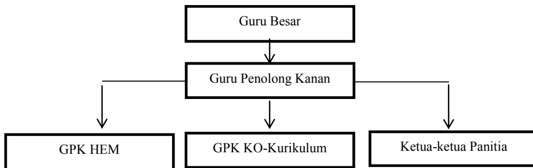
Rajah 2: Ahli Jawatankuasa Kewangan Sekolah

Sekolah ini mempunyai sebuah jawatankuasa kewangan seperti berikut ditunjukkan dalam Rajah 2.